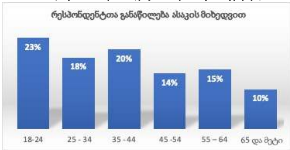
დიაგრამა 1. რესპონდენტთა ასაკობრივი მაჩვენებელი

პანდემიის პირველი ტალღის დასრულებისას და შეზღუდვების მოხსნის შემდეგ თითქმის ყველა გამოკითხულმა იმოგზაურა საქართველოში სხდასხვა მიზნით, მათ შორის 40%-მა იმოგზაურა იმერეთში.